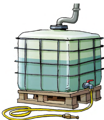
Cuve de récupération d'eau de pluie

La 2ème phase du projet débute le 18 mai 2026, elle permettra aux particuliers de bénéficier d'une aide financière pour acquérir des équipements hydro-économiques et des cuves de récupération d'eau de pluie.